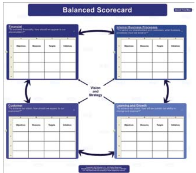
Die Balanced Scorecard unterstützt die Führung eines Unternehmens. Mindjet liefert Ihnen dazu das ideale Werkzeug.

Mit MindManager 8 können Sie zeigen, was Sie können, weil Sie sich damit