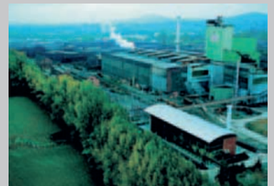
Das Stahlwerk im Grünen: die Georgsmarienhütte GmbH

Die DV-Koordination der Georgsmarienhütte GmbH möchte für alle Schwestergesellschaften am eigenen Standort ein Lizenzmanagementsystem bieten, das auch den zukünftigen Anforderungen gerecht wird. Somit gibt es viele gute Gründe, mit Insight als Consulting Partner dieses License Management Program (LMP von Microsoft) durchzuführen.