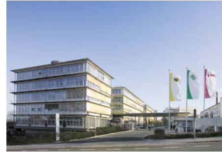
Abb. 1: Das INA-Stammwerk in Herzogenaurach

Die Mitarbeiter und ihr Wissen: Nie waren sie so wertvoll wie heute - das gilt in besonderem Maße für Technologieunternehmen. Die Schaeffler Gruppe ist einer der großen Automobilzulieferer weltweit und will ihre Spitzenposition durch gutes Wissensmanagement stabilisieren. Das Unternehmen nutzt deshalb Softwaretools für das Wissensmanagement, um Unternehmenswissen effizient in die tägliche Arbeit ihrer Mitarbeiter zu integrieren. Damit Wissen per Mausclick in jeder Anwendung verfügbar ist, setzt Schaeffler auch die Software Babylon-Enterprise ein.