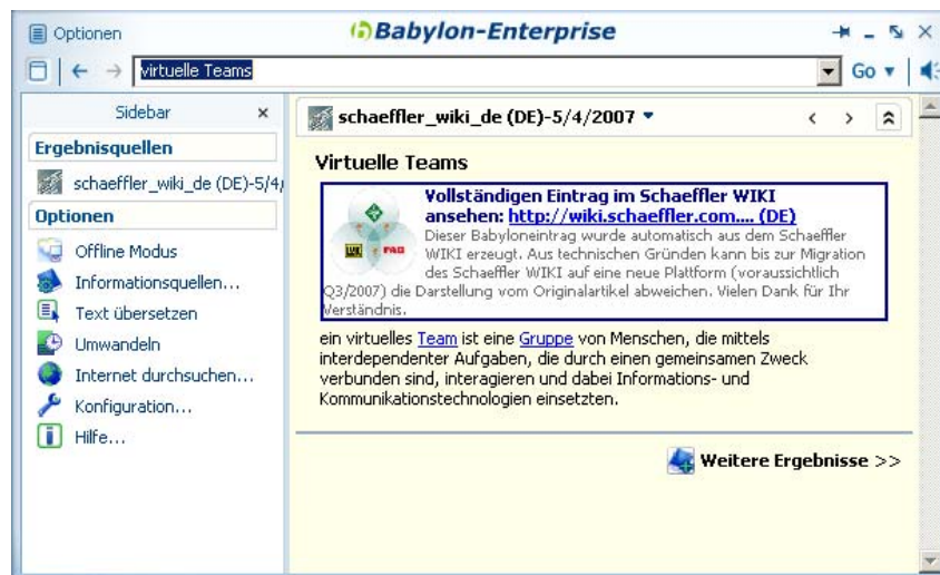
Abb. 3: Firmen-eigenes Schaeffler-Wiki

Damit erhalten die Anwender schnell Zugang zu neuen und geänderten Einträgen. Bei Bedarf führt ein Link im Babylon-Ergebnisfenster zum kompletten, ausführlichen Artikel im Schaeffler-Wiki.