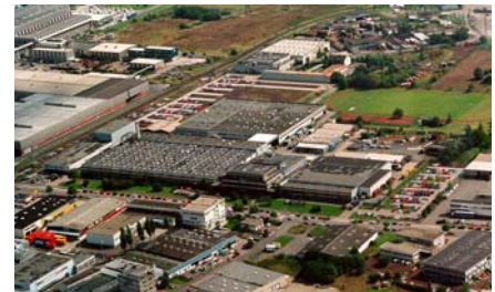
Abb. 1: TRW Automotive, Werk Koblenz

TRW Automotive zählt mit einem Umsatz von über 13 Milliarden US-Dollar zu den zehn größten Automobilzulieferern weltweit. Alleine in Deutschland verfügt das Unternehmen über mehr als 11.000 Mitarbeiter an 19 Standorten. In vielen Produktbereichen spielt TRW eine führende Rolle, z.B. bei Bremssystemen, Fahrerassistenzsystemen, Lenkungs- und Fahrwerkssystemen, Nutzfahrzeuglenkungen, Elektronik, Motorkomponenten, Befestigungssystemen und Insassenschutzsystemen sowie im Ersatzteilgeschäft. Die Zusammenarbeit intern zwischen den globalen Standorten und extern mit den großen internationalen Automobilherstellern sowie die Kommunikation in vielen Sprachen ist tägliche Übung im Konzern. Die Mitarbeiter, die nicht in ihrer Muttersprache kommunizieren, brauchen dabei effiziente Werkzeuge, um schnell unbekannte Begriffe und Terminologien nachzuschlagen.