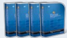
Visual Studio Team System 2008 Role Editions