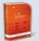
Visual Studio 2008 Professional Edition

MSDN Embedded — Bei MSDN Embedded handelt es sich um eine Variante von MSDN Professional, die statt SQL Server die Windows Embedded-Betriebssysteme für Entwicklungs- und Testzwecke enthält. Ansonsten sind MSDN Embedded und MSDN Professional identisch. MSDN Embedded ist für Embedded-Entwickler, Tester und IT-Profis geeignet, die bei Softwareentwicklungsprojekten auf